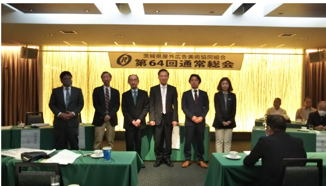
新執行部役員の皆様